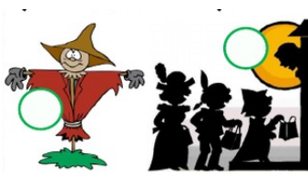
SCARECROW TRICK OR TREAT