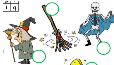
WITCH BROOM SKELETON